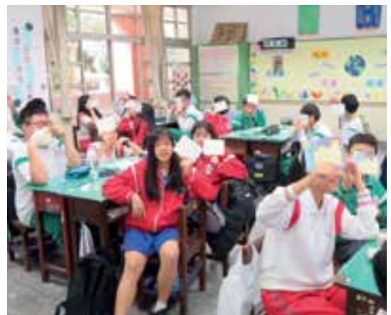
Des étudiant-e-s et des enseignant-e-s à Taiwan organisent des événements de rédaction de lettres avec Amnesty International à l'occasion de la campagne Écrire pour les droits 2019.

Si vous n'êtes pas habitué-e aux méthodes d'apprentissage participatives, nous vous invitons à consulter le Manuel d'animation d'Amnesty International. Vous le trouverez à l'adresse