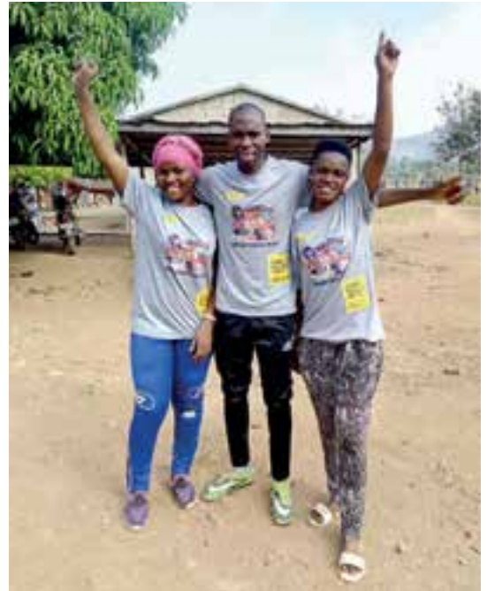
Des membres d'Amnesty International Togo prennent part à la campagne Écrire pour les droits 2019. Chaque année, ils mobilisent des personnes dans tout le pays.

Depuis les atrocités commises pendant la Seconde Guerre mondiale, les instruments internationaux relatifs aux droits humains, à commencer par la Déclaration universelle des droits de l'homme, ont apporté un cadre solide aux législations nationales et régionales, ainsi qu'au droit international, visant à améliorer la vie de tous les êtres humains. Les droits humains peuvent être considérés comme des lois que doivent appliquer les gouvernements. Les gouvernements et les fonctionnaires de l'État ont l'obligation de les respecter, de les protéger et de les concrétiser dans leur zone de compétence mais aussi à l'étranger.