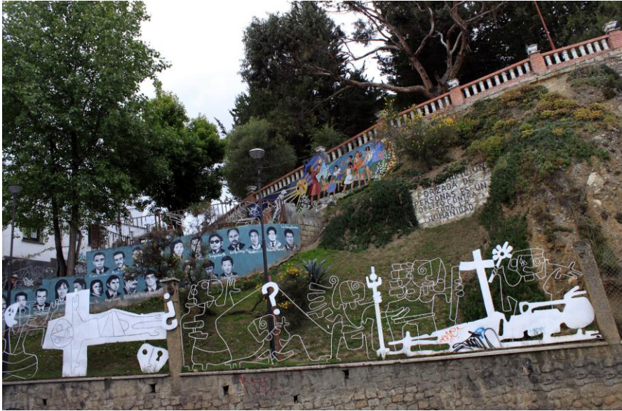
Izq.: Plaza José Carlos Trujillo Oroza, víctima de desaparición forzada durante el gobierno militar de Hugo Banzer. La plaza es a la vez un homenaje a otras víctimas de desaparición forzada.