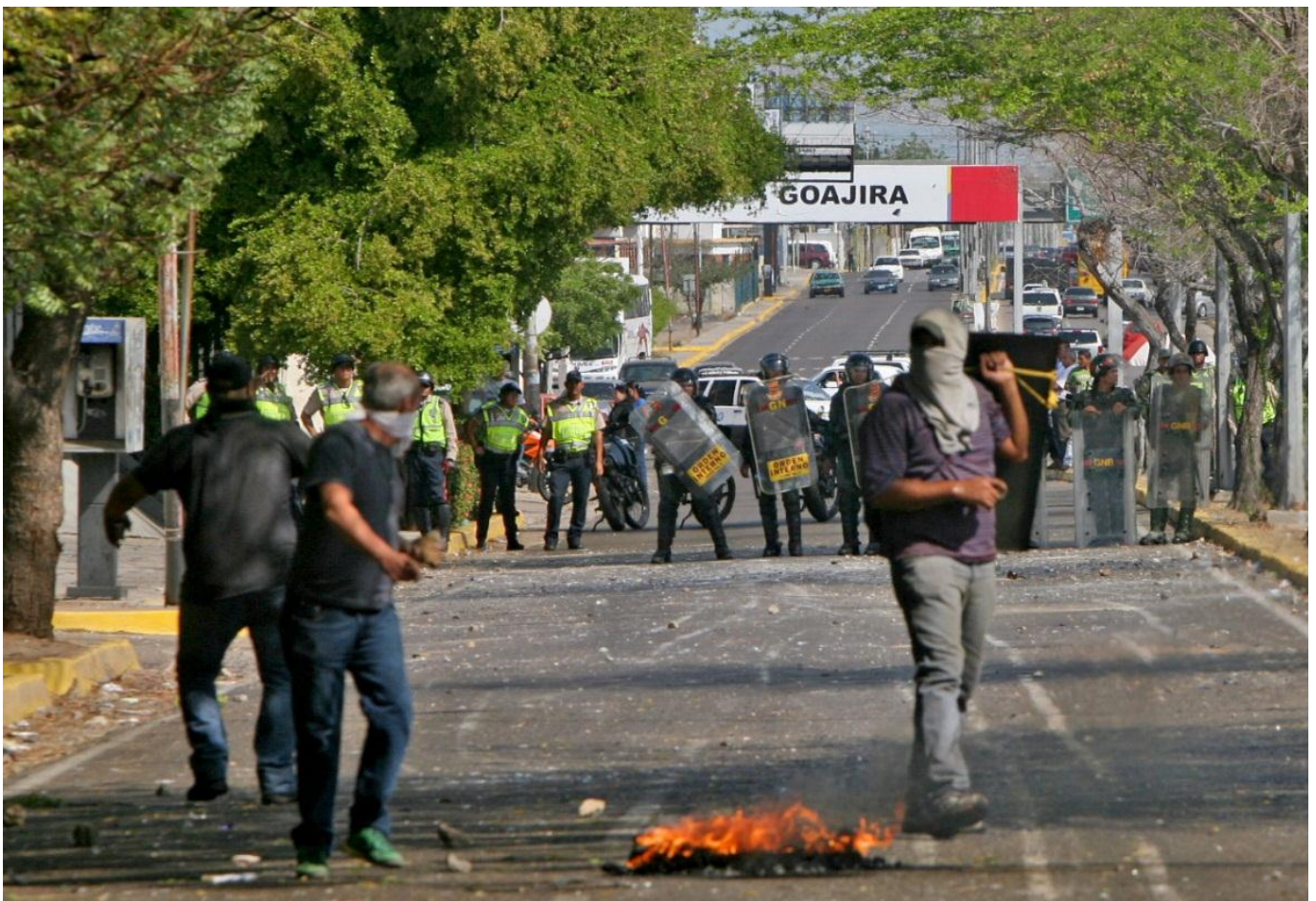
Abajo: Protestas en Estado Zulia, marzo 2014