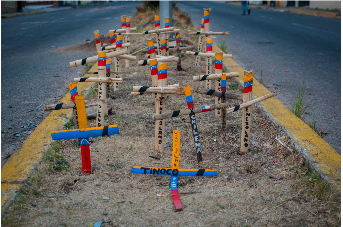
Arriba: una serie de cruces representan las personas que han muerto a un mes del inicio de las protestas, estado Táchira, marzo 2014