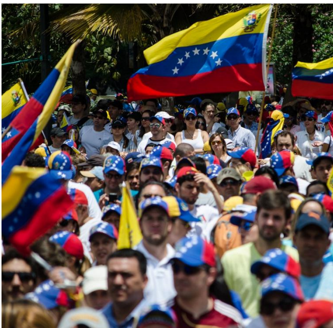
Abajo derecha: Marcha en apoyo al gobierno, 22 marzo 2014