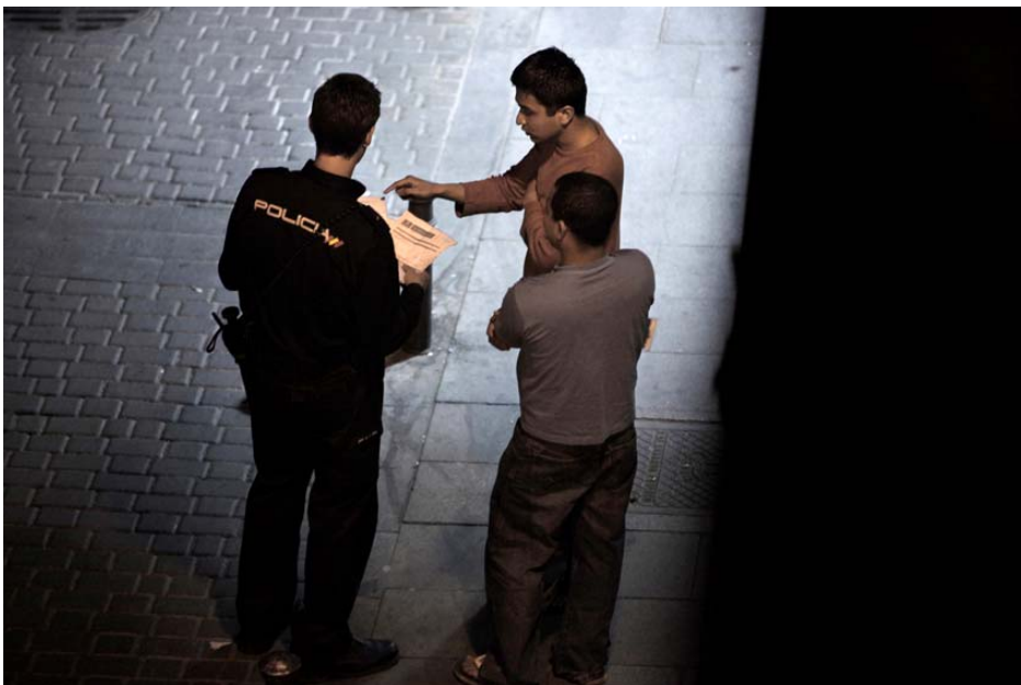
Contrôle d'identité dans le quartier de Lavapiés (Madrid), mai 2010.

Malgré ces assurances, les recherches d'Amnesty International la conduisent à conclure que les personnes issues des minorités ethniques continuent à être ciblées lors des contrôles d'identité.