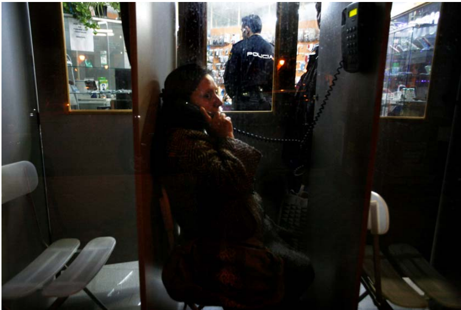
Police nationale dans un locutorio du quartier d'Usera (Madrid), janvier 2011.

Le représentant d'un syndicat de policiers a déclaré à Amnesty International : « Si vous devez repérer des étrangers, toute personne qui a l'air d'un étranger, vous allez où vous savez que vous en trouverez 28 ».