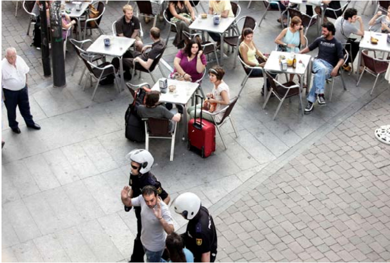
La police interpelle un migrant place Tirso de Molina (centre de Madrid), juin 2010.