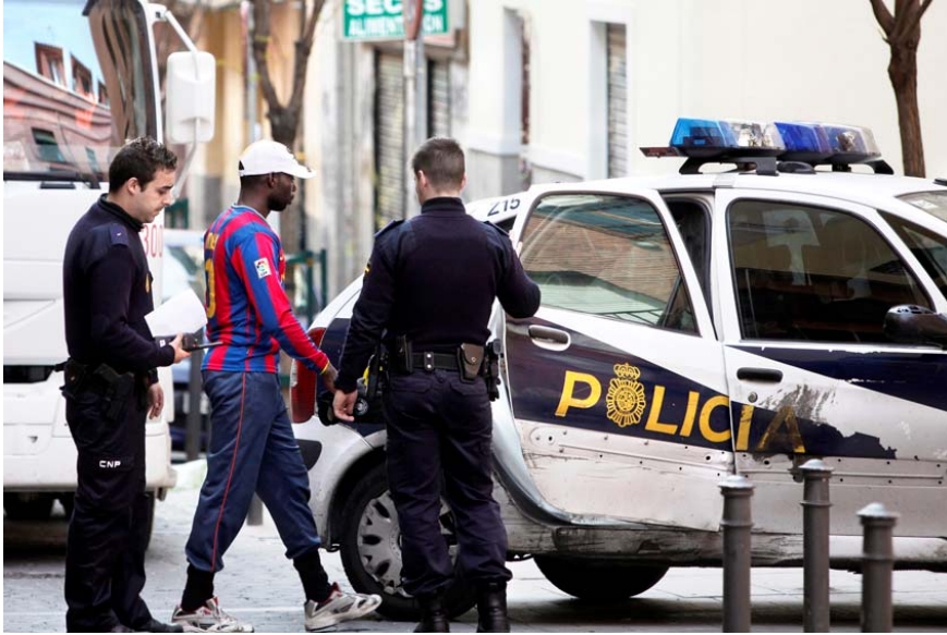
Un homme d'origine subsaharienne est conduit au poste de police, quartier de Lavapiés (Madrid), avril 2010.

Cette forme de « détention préventive » d'une personne qui a fourni des pièces d'identité n'est ni une détention à des fins d'identification, ni une détention dans l'attente d'un procès. D'après Inmigrapenal, groupe de professeurs de droit et d'experts en droit pénal, la « détention préventive » de personnes ayant fourni une preuve de leur identité ne repose sur aucun fondement juridique et est contraire à l'article 17-1 de la Constitution espagnole, l'article 9 du Pacte international relatif aux droits civils et politiques (PIDCP) et l'article 5-1 de la Convention européenne des droits de l'homme 50 .