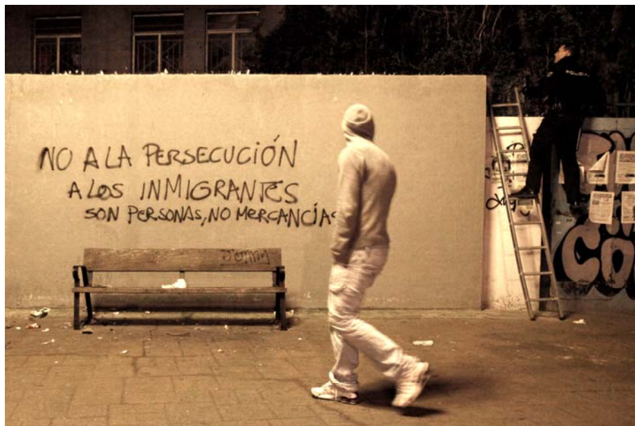
Inscription sur un mur dans le quartier d'Usera (Madrid), mars 2010.

Déclaration publique de l'Association des sans-papiers de Madrid, mai 2010.