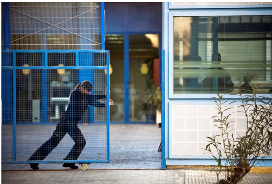
Centre de détention pour étrangers (CIE) dans la Zone franche de Barcelone, janvier 2011.