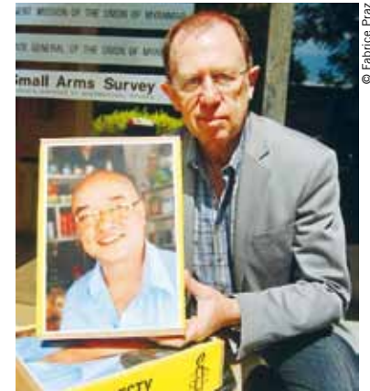
Remise de la pétition pour Zarganar à la Mission du Myanmar à Genève, le 17 juin 2011.

en solidarité avec le Printemps arabe à Bâle, le 12 février, s'est transformée en un moment de fête. Des messages de salutations envoyés aux défenseurs et défenseuses des droits humains en Egypte ont remplacé les revendications que la Section suisse avait initialement prévues d'adresser au président déchu. Il s'en est suivi une succession d'événements, de manifestations et de transformations politiques en Afrique du Nord et au Moyen-Orient. Dans le cadre d'actions