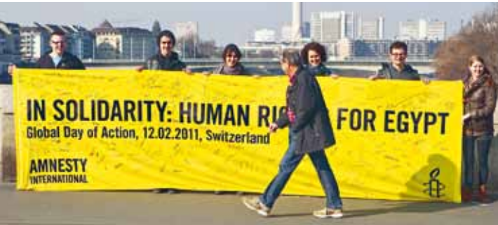
12 février 2011, manifestation de solidarité en faveur des droits humains en Egypte.

Pour célébrer les 50 ans d'Amnesty International, la Section suisse a organisé une série d'actions spéciales. Elles ont démarré le 16 mai, avec la campagne en faveur du prisonnier politique et humoriste birman Zarganar, qui a abouti à sa libération le 12 octobre! Des pétitions ont ensuite été lancées sur le désastre de l'exploitation pétrolière dans le delta du Niger, sur les droits des jeunes filles au Nicaragua, contre les expulsions forcées à Port Harcourt au Nigéria et pour l'abo-