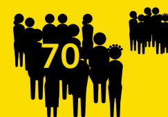
70 sections nationales