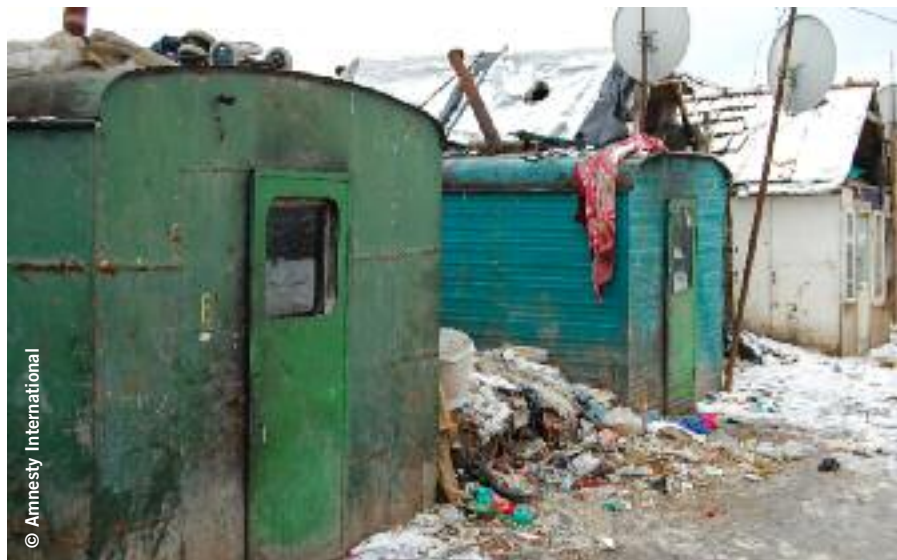
À droite : Conteneurs métalliques dans lesquels vivent des familles roms rue Primaverii à Miercurea Ciuc/Csíkszereda, district de Harghita, Roumanie (janvier 2009).