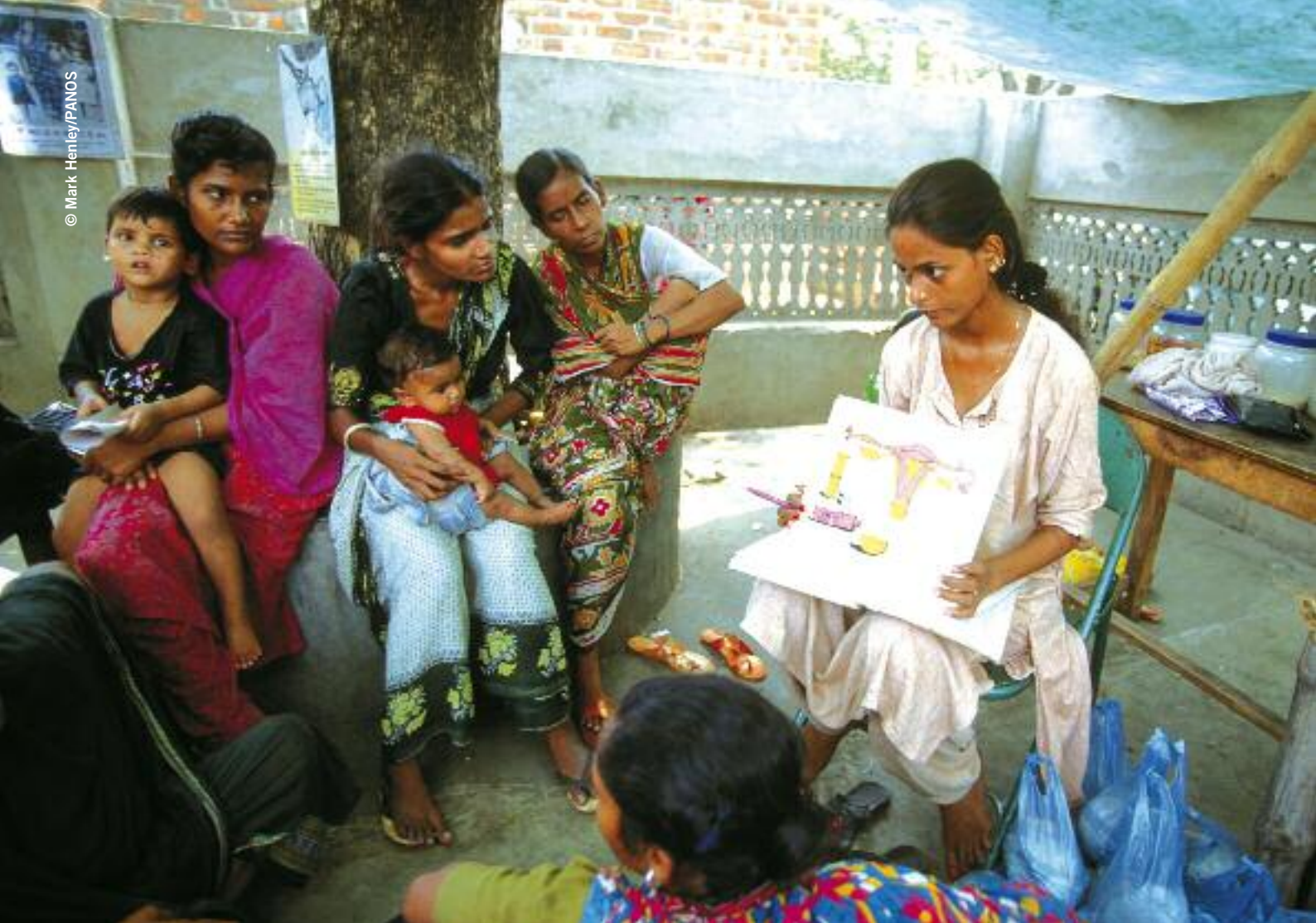
Ci-dessus : Des femmes participent à des cours sur le contrôle des naissances pour les habitants des bidonvilles et les personnes qui dorment dans les rues à Calcutta, Inde (2004).